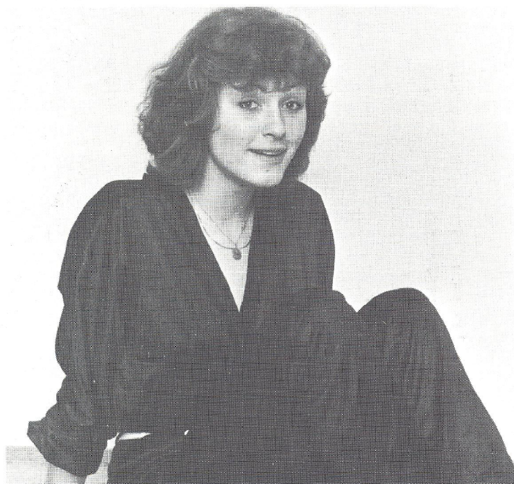
Spot på den sorte dragt — og shadow-knappen benyttet.

efter sidste billede er taget. Batteri-check-funktionen er bibeholdt og med lyssignal. Samtidig slukker den for kameraet, hvis man skulle fortryde midt i en langtidseksponering. Automatikken er garanteret en eksponeringsnøjagtighed på op til 2 min., men den giver fuldt tilfredsstillende resultater på meget længe tider.