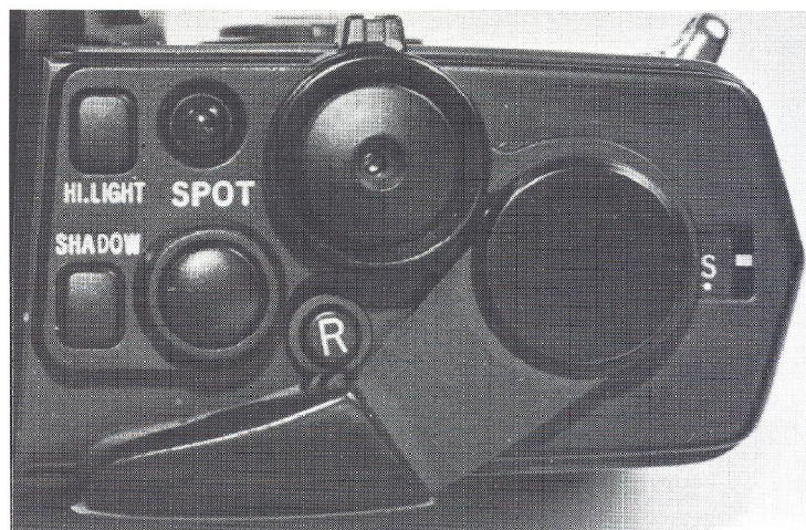
Olympus OM-4 med de nye knapper